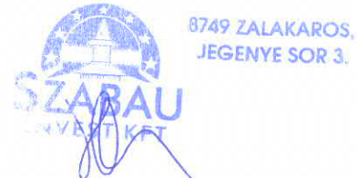
Vállalkozó (cégszerű aláírás)